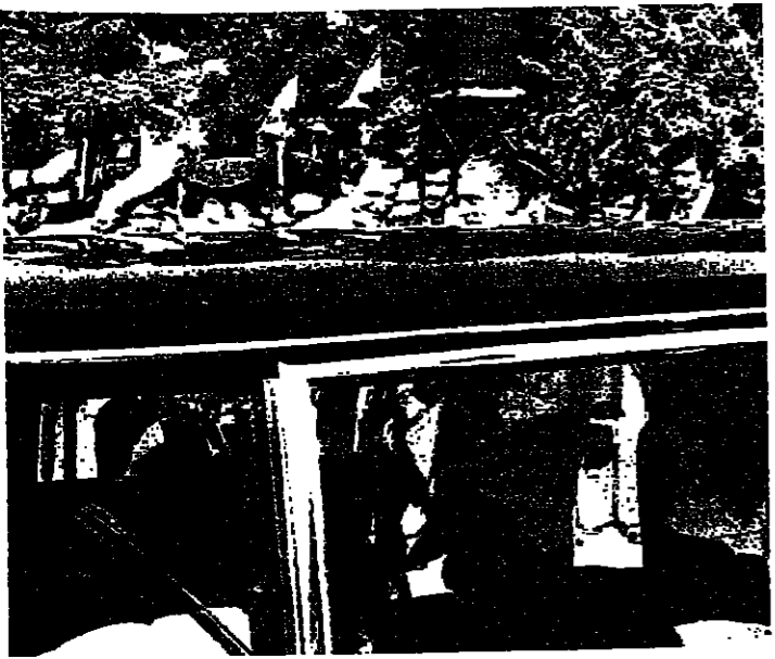
الاسد يودع سركيس الى سيارة الرئاسة